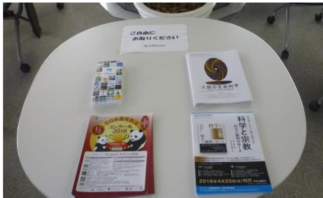
日本科学協会のパンフレット類