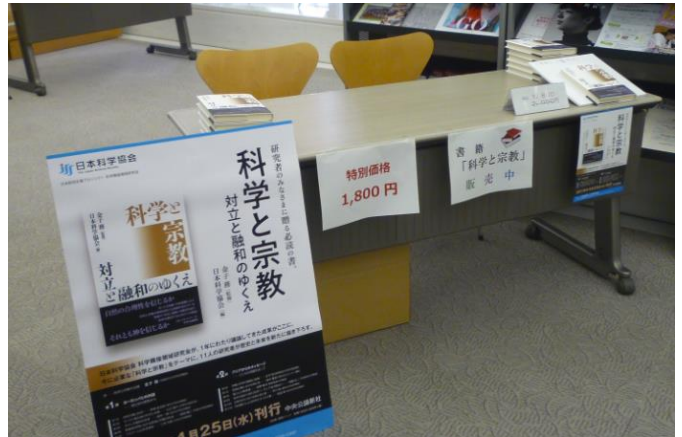
書籍販売コーナー